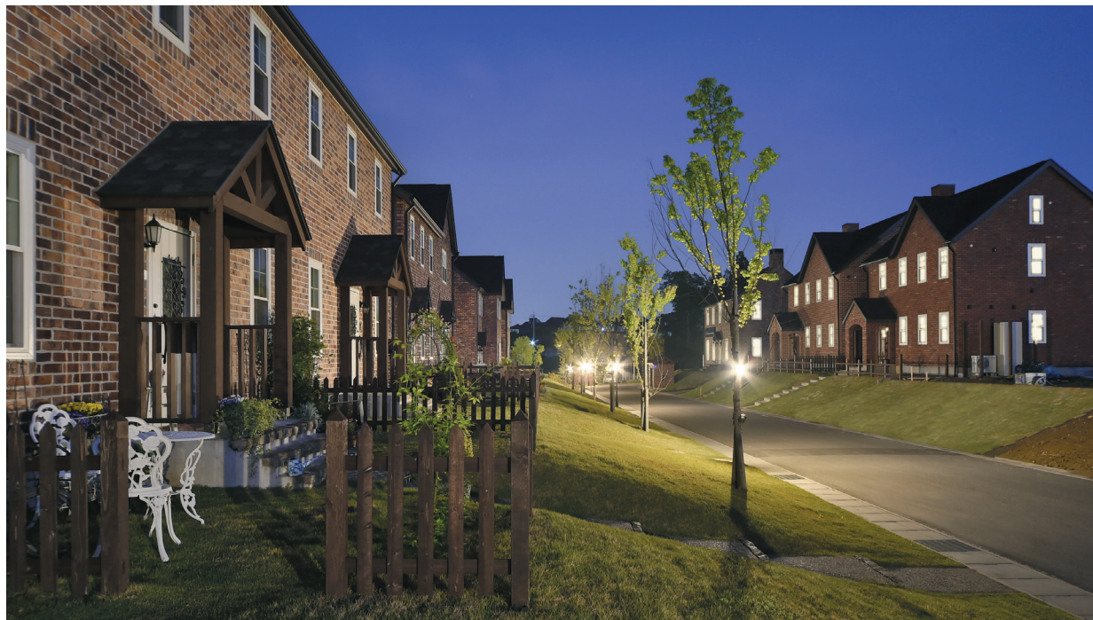
Street View「街並景観」を意識した設計DESIGN